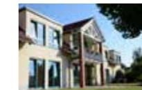
Betreuung vollstationär , Plätze 27, Wohngruppen 3, barrierefrei ja

1 Haus Barnimer Feldmark Hirschfelde · Werneuchener Straße 1 B · 16356 Werneuchen