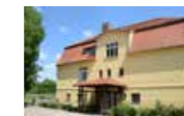
Betreuung vollstationär , Plätze 16, Wohngruppen 2, barrierefrei nein , geplanter Erweiterungsbau barrierefrei ja

In der rollstuhlgerechten Wohneinrichtung in ländlicher Umgebung werden Menschen mit mehrfacher Behinderung und besonderen Verhaltensauffälligkeiten betreut.