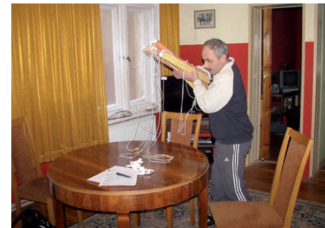
Geschützte Wohnungen bei RC fkr