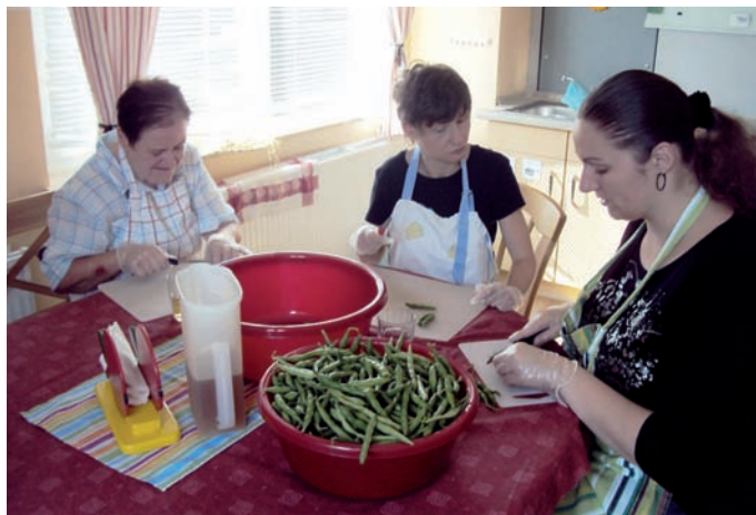
Wohnen und Arbeiten bei RC rehaconsult